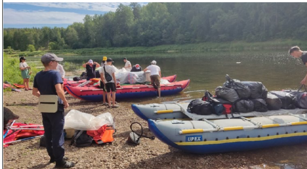
Фото достопримечательностей на маршруте

На днёвке также можно прогуляться до скалы Ягуда-таш, посетить смотровые площадки. Продолжаем водный маршрут на 3-й день. После сухих водопадов появляется остров. Обходим левой протокой. Справа видна скала "Филин". Река поворачивает на запад, огибая высокие скалы Ягуда-таш. Через 1 км. река снова делает излучину, поворачивая на север, и перед нами открывается самое живописное место на Ае - скалы Большие Айские притёсы. На расстоянии 1 км простираются отвесные скалы высотой до 100 м. Здесь есть несколько пещер: грот Юношеский, Первая и Вторая Кулуарные. На вершинах скал оборудованы экстремальные аттракционы (прыжки со скалы, скатывание по тросу и др.). Сейчас подъем на вершины скал оборудован металлической лестницей. Она расположена в кулуаре. По ней можно быстро и легко подняться на смотровые площадки. На площадках имеются бутики с сувенирами, кафе. Через 1,5 км после Больших Притёсов на правом берегу Ая начинается деревня Кульметово. Она раскинулась у подножия горы Косой гребень. В деревне имеется магазин, на берегу располагаются родники. В конце деревне река поворачивает на запад. На