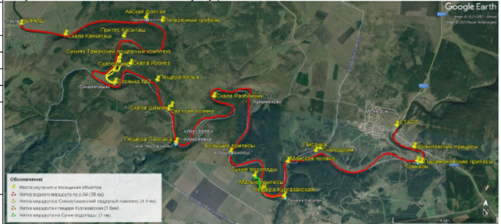
Карта с нанесенной ниткой маршрута

Сплав начинаем с автомобильного моста пгт. Межевой Челябинская область. Сразу после старта на правом берегу появляются отвесные скалы - Цепиловские притёсы с огромной зияющей аркой. После скал река делает крутую петлю, разворачивается на 180° на запад. Проходим небольшой перекат. На левом берегу появляется новая скальная гряда- Парамоновские притёсы с выходом реки Каменки из гидротехнического тоннеля. На протяжении 3-х км. вдоль берегов тянутся дачные постройки посёлков Айская группа, Первомайка. На очередном левом повороте появляется скала "Скалодром" с крупным Гротом в начале скалы. В конце скалы находится писаница "Айская группа. Вскоре река поворачивает резко на юг. На левом берегу открывается вид на Майскую поляну. Здесь оборудован туристский стационарный лагерь. Через 1 км. на маршруте появляется крупный остров.